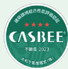
CASBEE不動産の評価ランク